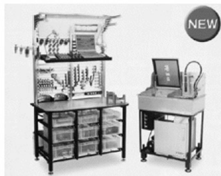
ツール・セットアップ・ステーション

また、同社の「ツール・セットアップ・ステーション」も、①ツールセッティング作業が安全に行う事ができる②コンパクトで場所をとらず、簡単な組み立て式である③などの特長を持つ「6S デスク」。 ①ツール洗浄ははじめ刃物、治具なども丸洗い②シンク一体型③給排水管工事は不要④などの特長を持つ「クリーンBOX」など、作業現場に欠かせない新商品です。ご用命をお待ちしております。