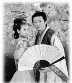
中国事業部 貝 路